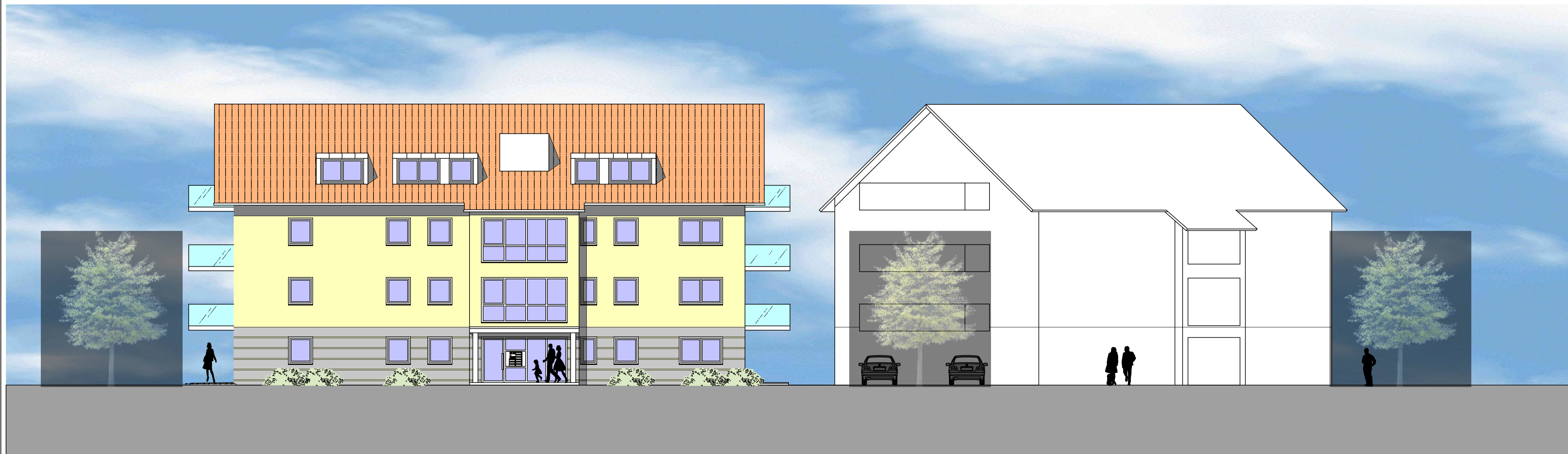
ANSICHT VON NORDOSTEN HAUS 3

NEUBAU VON 3 MEHRFAMILIENHÄUSERN- 35 WE MIT TIEFGARAGE FÜSSENER STRASSE 17 87640 BIESSENHOFEN