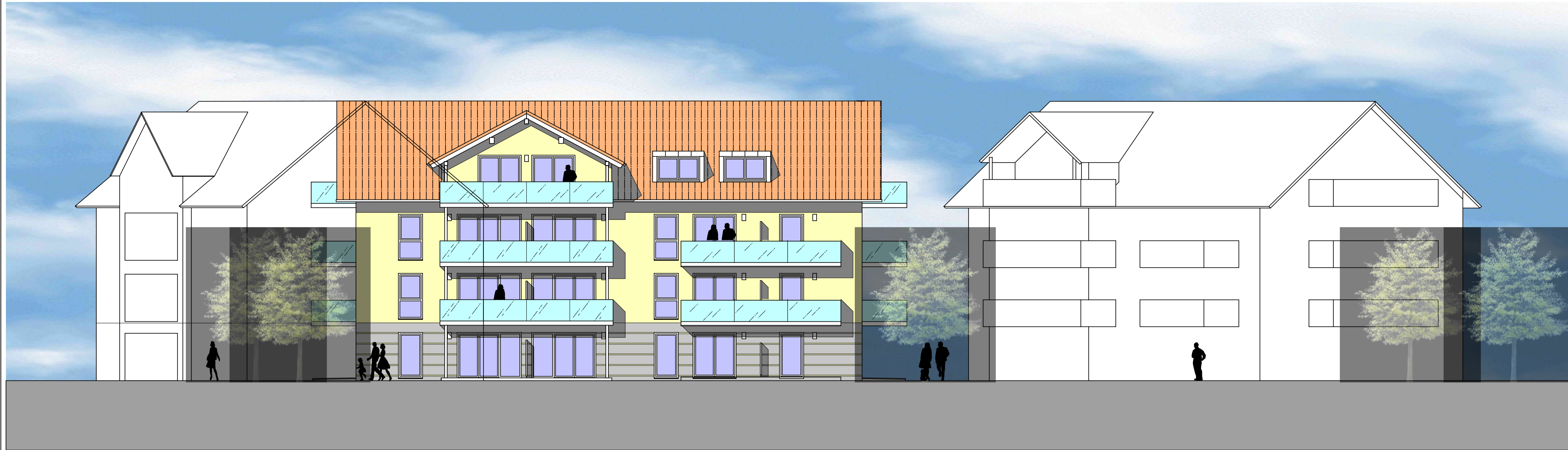
ANSICHT VON SÜDEN HAUS 2